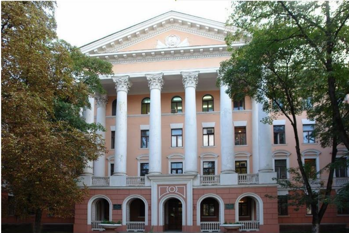
Симферополь. Геологоразведочный институт