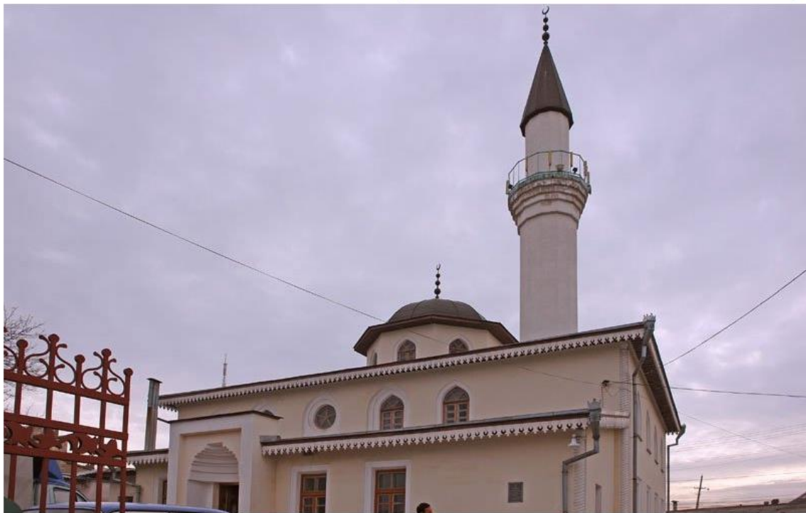
Симферополь. Мечеть Кебир-Джами 1508 года