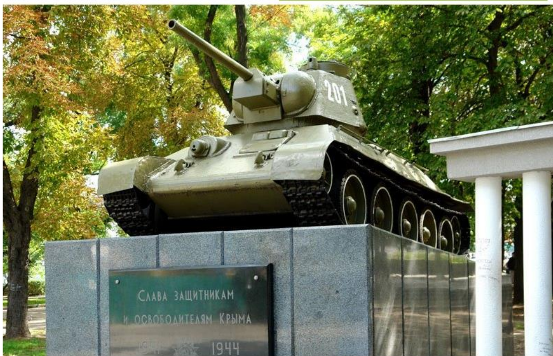
Симферополь. Сквер Победы