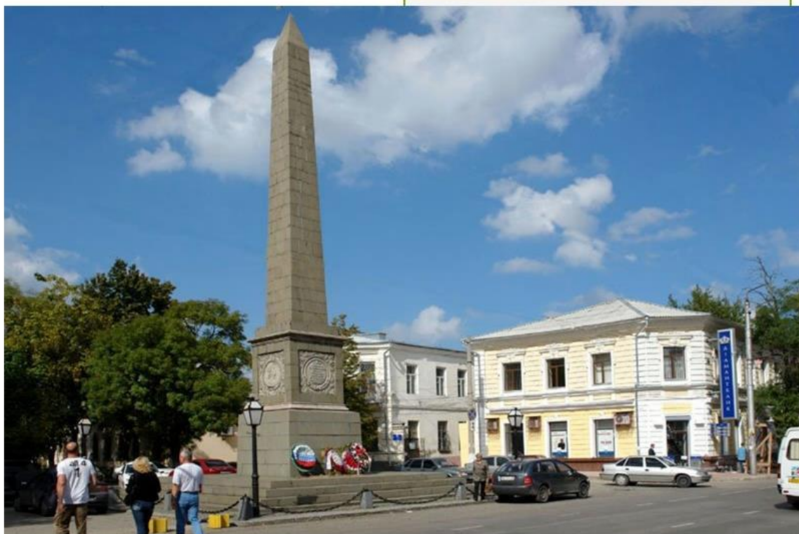
Симферополь. Обелиск в честь Долгорукова