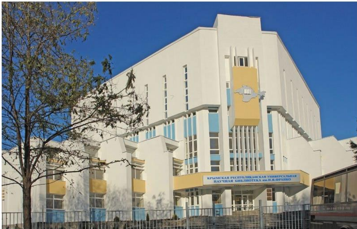
Симферополь. Библиотека им. И.Я.Франко