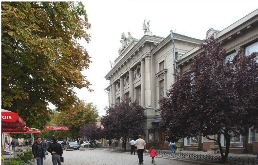
Симферополь. Улица Пушкина