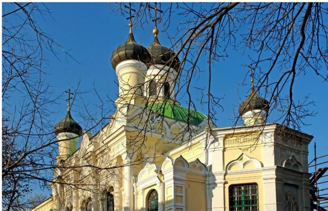
Симферополь. Церковь Трех Святителей