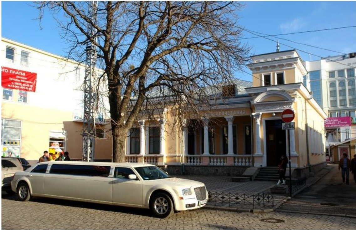
Симферополь. Дворец Бракосочетаний